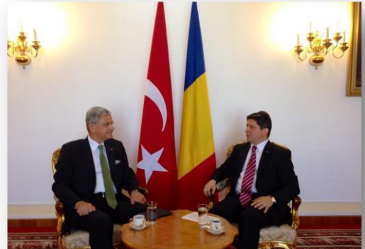
Dışışleri Komisyonu Başkanı Büyükelçi Volkan Bozkır, Romanya Dışışleri Bakanı Titus Corlatean tarafından kabul edildi. Büyükelçi Volkan Bozkır ve Bakan Corlatean, bölgedeki güncel gelişmeler hakkında görüş teatisinde bulundu. 7 Mayıs 2014