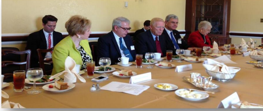
Dışışleri Komisyonu Başkanı ve Türkiye–ABD Parlamentolararası Dostluk Grubu Başkanı Büyükelçi Volkan Bozkır, ABD Kongresi Türkiye Dostluk Grubu Eşbaşkanları'nın kendisi onuruna verdiği yemeğe katıldı. 20 Mayıs 2014