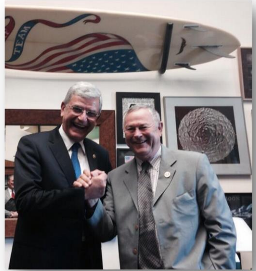
Dışışleri Komisyonu Başkanı ve Türkiye–ABD Parlamentolararası Dostluk Grubu Başkanı Büyükelçi Volkan Bozkır, ABD Temsilciler Meclisi Dışışleri Komitesi Avrupa, Asya ve Yükselen Tehditler Alt Komitesi Başkanı Dana Rohrabacher ile görüştü. 20 Mayıs 2014