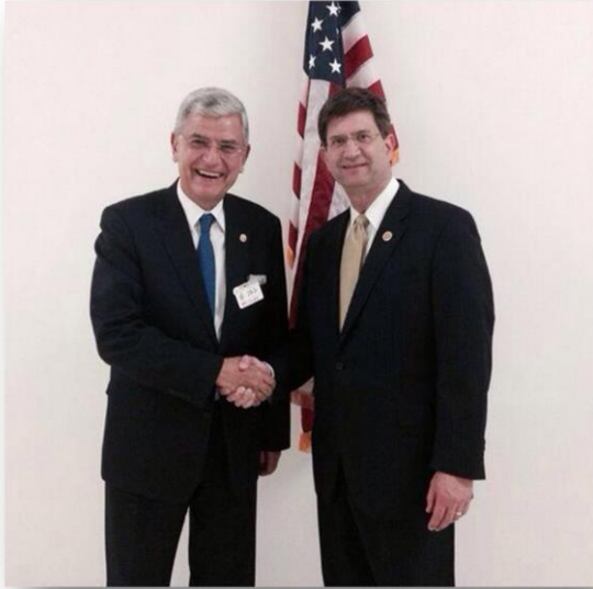
Dışışleri Komisyonu Başkanı ve Türkiye–ABD Parlamentolararası Dostluk Grubu Başkanı Büyükelçi Volkan Bozkır, ABD Temsilciler Meclisi Dışışleri Komitesi Terörizm, Yayılmanın Önlenmesi ve Ticaret Alt Komitesi Başkanı Brad Schneider ile görüştü. 20 Mayıs 2014