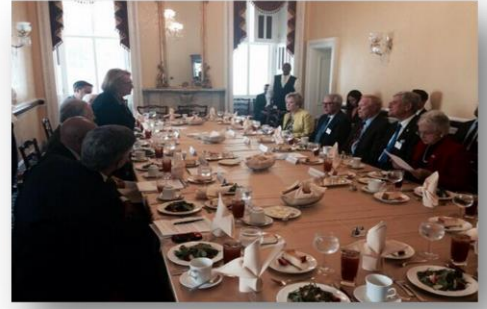
Büyükelçi Volkan Bozkır onuruna verilen yemeğe, ABD Kongresi'nden Gerald Connolly, Ed Whitfield, Virginia Foxx, Kay Granger, Sheila Jackson Lee, Mark Meadows, Erik Paulsen, Barbara Kennely, Dick Gephardt, Jim Moran ve Alcee Hastings katıldı. 20 Mayıs 2014