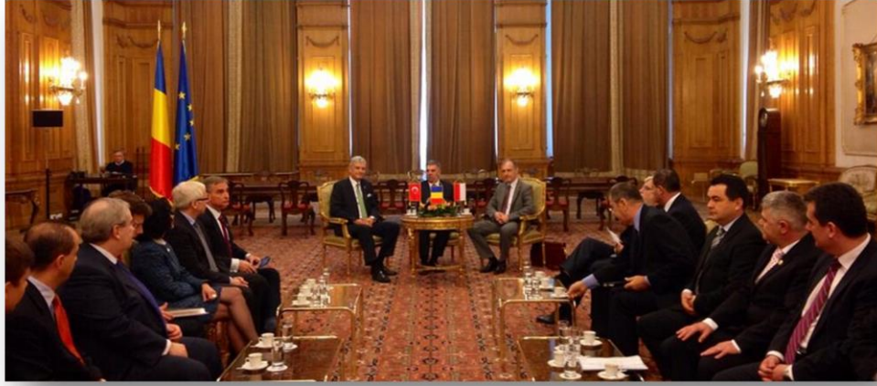
Dışışleri Komisyonu Başkanı Büyükelçi Volkan Bozkır ve Polonya Senatosu Dışışleri Komisyonu Başkanı Bogdan Klich, Romanya Temsilciler Meclisi Başkanı Sayın Valeriu Ştefan Zgonea tarafından kabul edildi. 7 Mayıs 2014