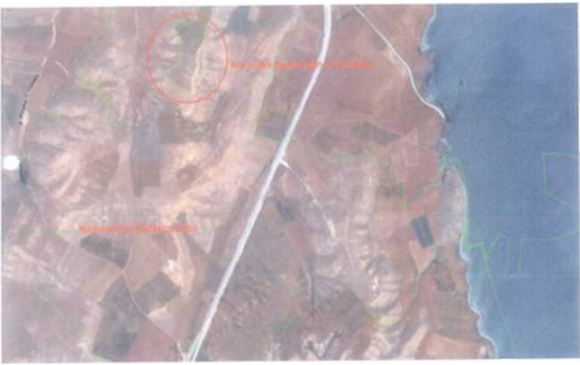
Şekil:3- Köy Sınırları dışında kalan 3. Öneri Alanı.