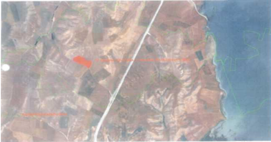
Şekil:2- Uygun Olarak Görülen Vatandaş Mülkiyetindeki 31 nolu parsel, yüz ölçümü: 29.677,56 m 2 , 2. Öneri Alanı.